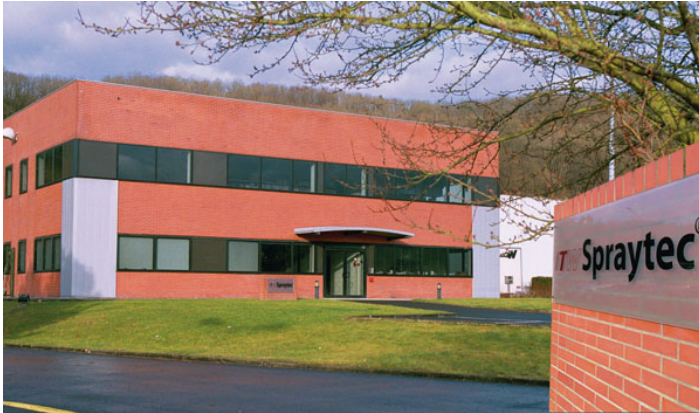
L'unité de production de la société ITW

Spraytec est située dans les Ardennes, à une cinquantaine de kilomètres de Charleville-Mézières, dans la ville de Vireux-Molhain. C'est au sein de cette usine que sont conçus et fabriqués 80% des produits commercialisés en France par le groupe via des réseaux de distribution dédiés.