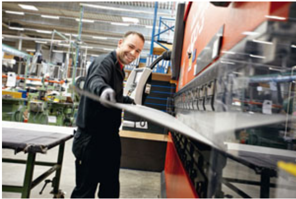
Travail du verre et du PVC

Pour la fabrication des fenêtres de toit en PVC, les matières premières principales sont du PVC blanc ou plaxé d'un décor imitation bois ainsi que des feuilles de verre (selon la saison, l'usine de Bad Mergentheim réceptionne quotidiennement trois à quatre camions de feuilles). Ces feuilles sont dans un premier temps coupées ou plutôt cassées à dimensions par une machine à commandes numériques. Du fait du risque d'éclatement, les verres feuilletés sont quant à eux usinés sur une machine spécifique qui effectue d'abord un trait de coupe sur chaque face de la feuille, une buse chauffante venant ensuite faire fondre le lien entre les deux traits.