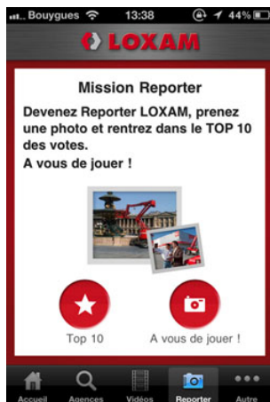
Nouvelle application iPhone

La version 2.0 de l'application iPhone de Loxam offre une interactivité totale entre le loueur, ses services à distance et le client en assurant ainsi les principales fonctionnalités du site Internet. L'internaute mobile peut ainsi se tenir informé à tout moment des nouveautés et des offres promotionnelles (vente ou location...) et recevoir toutes les actualités du réseau Loxam. De plus, pour impliquer et fidéliser ses clients de façon ludique, le loueur a lancé une rubrique « Mission Reporter » qui propose de mettre en ligne les dix photos de chantiers les plus remarquables. L'exploitation du caractère multimédia du support se traduit également par l'intégration de la chaîne « You Tube » dédiée au loueur qui diffuse les vidéos des nouveaux matériels en location chez Loxam.