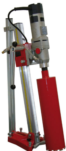
ATDV– Carotteuses électriques

ATDV propose des moteurs Cardi pour couronnes diamantées pourvus d'un emmanchement standard 1 1/4".