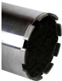
Peuvrel Outils Diamantés– Couronne RPX

La nouvelle gamme de forets Activ'Diam fabriquée en France par Samedia dispose de segments en forme de trapèze permettant un démarrage ultra-rapide. Grâce à leur arête tranchante Rooftop, l'outil pénètre instantanément dans le matériau. Les diamants sont par ailleurs saillants pour favoriser l'avivage de l'outil lors de la coupe. Cette gamme est disponible du diamètre 42 mm au diamètre 602 mm pour une longueur de 420 mm. Elle se décline en qualité pour le béton, le granit, l'asphalte, avec des raccords 1 1/4" et 1/2" gaz. Elle se complète également d'un foret assainissement béton d'une longueur utile de 300 mm.