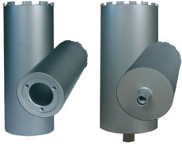
Abras – Couronne Diamand

La Série D800 de Husqvarna se compose de forets à haut rendement, avec un accent mis sur la longévité et la maîtrise. Elle couvre la majorité des utilisations dans le bâtiment et les travaux publics. Les forets sont soudés au laser pour pouvoir forer à sec dans les tuyaux en béton sans souci. Leur conception, qui réduit le frottement latéral, augmente la maîtrise de l'outil.