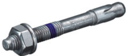
Goujons HSA, HST