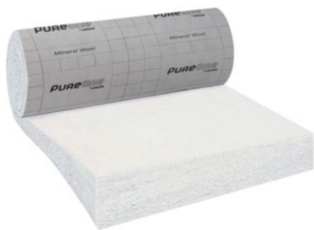
Pure 40 RP