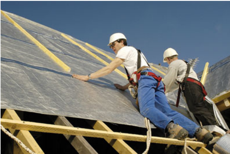
Le marché de l'isolation thermique,

L'isolation est utilisée pour réduire les besoins en énergie, les nuisances sonores et améliorer le confort et la qualité de vie des bâtiments neufs ou existants, résidentiels ou collectifs. Depuis 2005 et la révision de la Réglementation Thermique (RT 2005), elle connaît un nouvel élan. En effet, outre une amélioration de 15% des performances thermiques par rapport à la RT 2000, la dernière normalisation s'applique aux bâtiments déjà existants et non plus exclusivement aux bâtiments neufs s'ouvrant ainsi sur le marché de la rénovation. L'isolation a donc franchi un nouveau palier et fait désormais des incontournables au sein de la distribution.