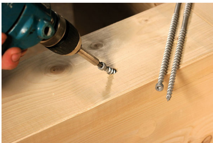
Les négoce généralistes et bois-panneaux

Les libres-services occupant une place de plus en plus importante dans le chiffre d'affaires des négoce matériaux et bois-panneaux, la visserie bois bénéficie d'une plus grande visibilité et se présente dorénavant comme un produit stratégique et non plus comme un consommable de dépannage. En élargissant leur offre à des longueurs et diamètres plus importants, les distributeurs se sont ouvert les portes d'une nouvelle clientèle regroupant des charpentiers et autres constructeurs de maisons à ossature bois. Surtout, ils ont renforcé leur image de spécialiste aux yeux des artisans pour mieux se démarquer de la concurrence des GSB. Dans un contexte économique miné par des conjonctures encore tendues et des prévisions peu convaincantes, s'intéresser davantage à la visserie bois est également l'occasion pour les distributeurs de réaliser des marges encore très avantageuses tout en générant des ventes additionnelles. D'autant que le marché de la visserie bois est encore loin d'être en récession.