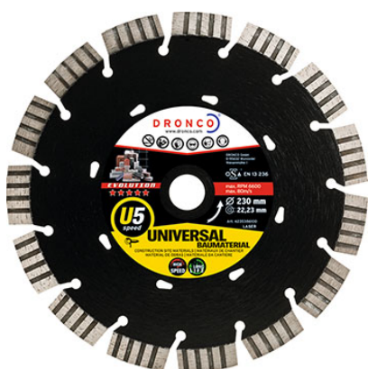
Dronco - Osborn

Le marché français des disques diamantés, en 2015, pesait 80 millions d'euros pour deux millions d'unités vendues, selon les chiffres communiqués par le SNAS (Syndicat National des Abrasifs et Superabrasifs). Par ailleurs, la France représente 15% du marché européen.