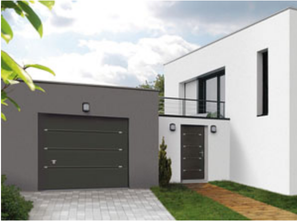
Porte d'entrée Zen