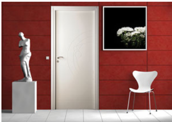
Porte intérieure Planet

Filiale du Groupe Masonite, Premdor France est aujourd'hui un des intervenants majeurs du marché français dans le développement, la fabrication et la commercialisation de portes et blocs-portes bois et métalliques. Avec ses sept entités industrielles, le groupe offre un choix large et complet de produits qui répondent aux exigences actuelles tant sur un plan technique qu'esthétique.