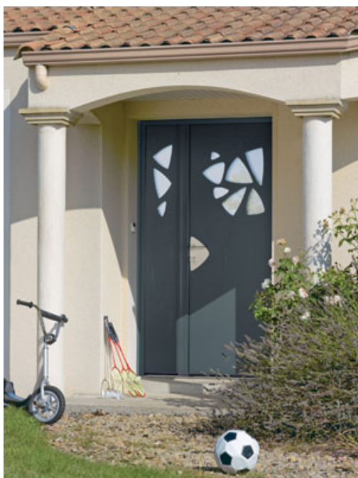
Porte d'entrée Sphinx Efle

Installé à Cholet, CAIB est spécialisé dans la fabrication de menuiseries depuis plus de trente ans. Filiale du groupe Liebot, le groupe dédie entièrement son activité à la distribution. En 1994, il lance une nouvelle gamme de portes d'entrée commercialisée sous la marque Sphinx.