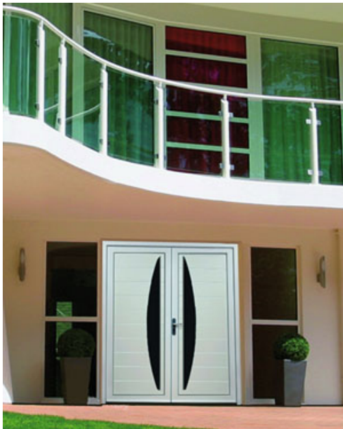
Portes d'entrée Lys

Créée en 1862 à Saint-Martin-Le-Châtel près de Lyon, la société MAB (Menuiserie Artisanale Bressane) se consacre initialement dans la conception et la fabrication de produits de menuiserie en bois avant de se recentrer uniquement sur les portes d'entrée. Aujourd'hui, sa fabrication s'étend également au PVC et à l'acier, aussi bien dans des dimensions standard qu'en sur-mesure.