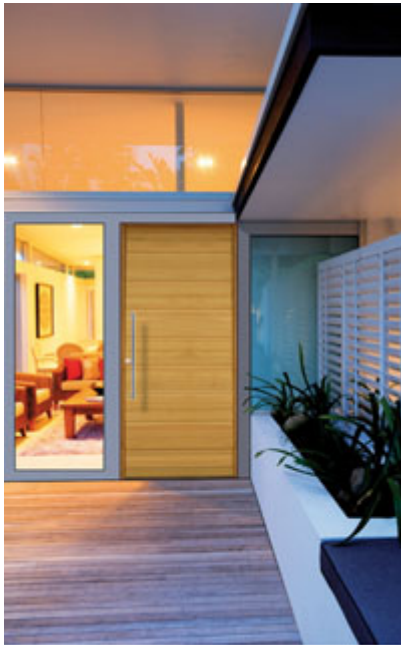
Portes d'entrée Gavarnie

Matériaux : bois de pays (chêne, mélèze, pin, châtaignier)