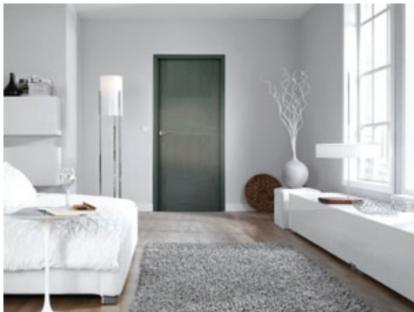
Porte intérieure Solfège

postformés, avec pour leitmotiv d'assurer fiabilité et design contemporain.