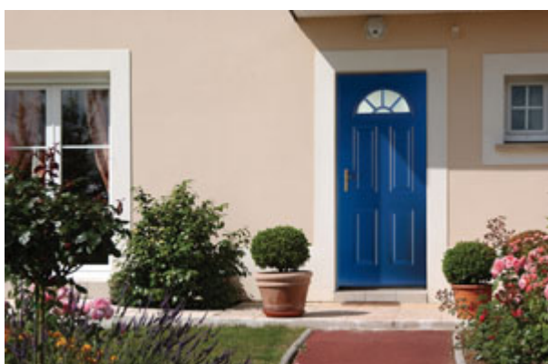
Porte d'entrée Emeraude