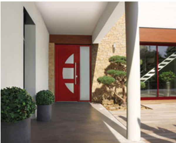
Porte d'entrée Ostende