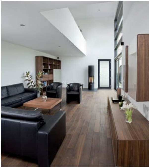
Porte d'entrée Sphinx Stellium