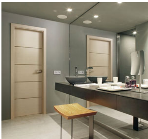
Porte intérieure Harmonie