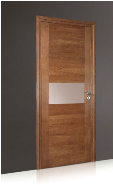
Porte intérieure Nova

Société familiale spécialisée dans le travail du bois, Proboporte a su concilier au cours des années savoir-faire et techniques modernes pour fabriquer des portes positionnées sur le haut de gamme. Avec des lignes Authentique, Contemporaine ou Design, en standard ou en sur-mesure, elle bénéficie de collections larges aussi bien pour les façades de cuisine que pour les placards ou les portes d'intérieur.