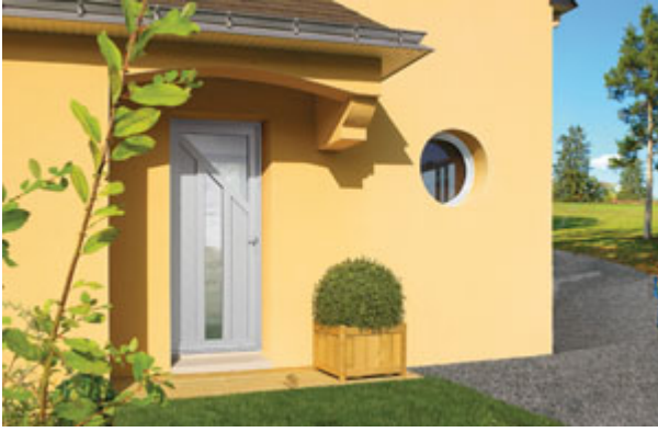
Porte d'entrée Le Faou