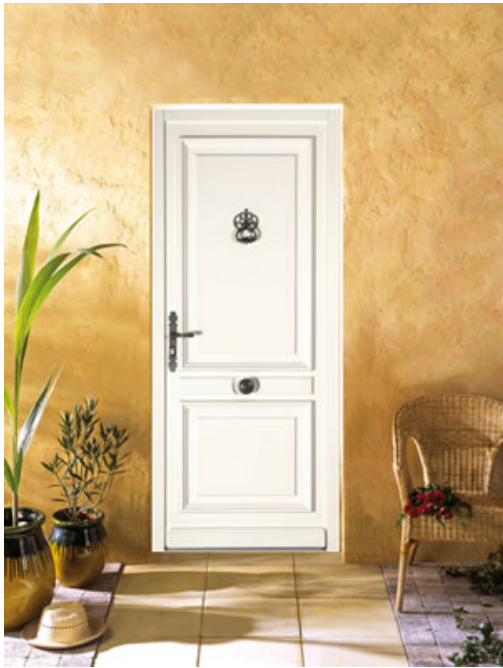
Portes d'entrée Valence