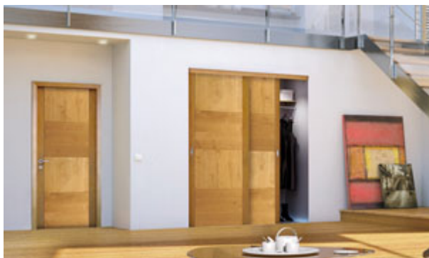
Porte intérieure Roziere Zephyr

Matière bloc-porte : chêne massif lamellé