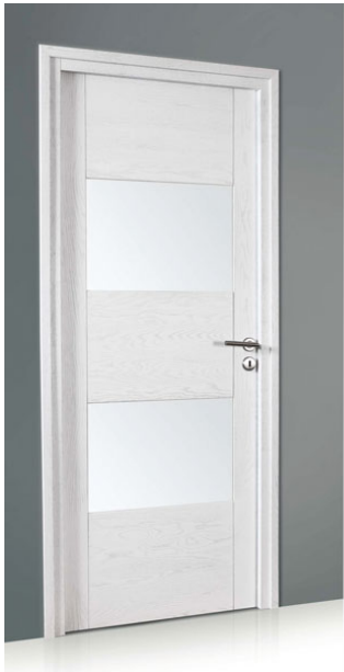
Porte intérieure Morelia

Matière bloc-porte : chêne massif lamellé collé