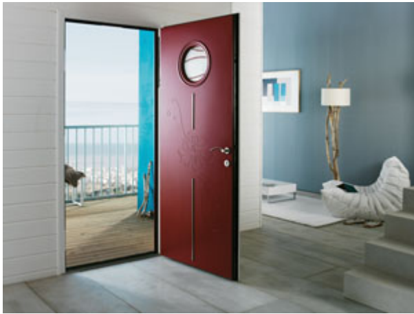
Porte d'entrée Salanza