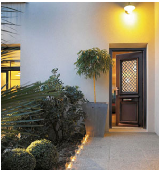
Porte d'entrée Athena

Depuis 1986, Bel'M conçoit et fabrique des portes d'entrée au sein de ses trois sites de production. En 1993, elle s'impose comme un acteur majeur sur le marché français avec le lancement de portes en acier postformé. Depuis, le groupe ne cesse d'innover tout en affichant sa responsabilité environnementale.