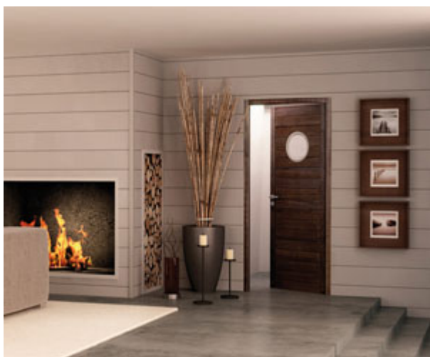
Porte intérieure Menuiseries d'Olt Calypso

Matière bloc-porte: bois exotique clair (Ayous)