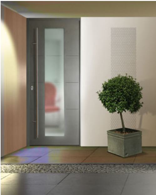
Portes d'entrée Vénus