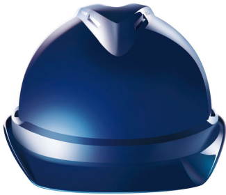
MSA Gallet - V-Gard 500

* Une face testée : côté gauche, côté droit, devant ou derrière avec une inclinaison comprise entre 15 et 60°