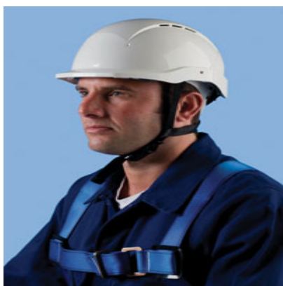
Centurion - Casque monteur

D'abord fabricant de gants de protection, la société Singer Frères propose aujourd'hui une gamme complète d'EPI que ce soit pour la protection des pieds, de la main, du corps et bien entendu de la tête. Pour cette dernière famille, elle se présente comme un partenaire des distributeurs avec de nombreuses références de lunettes, casques anti-bruit et casques de chantier.