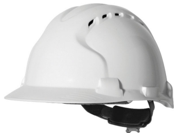
JSP France – Evolite

toits...). Basée à Crolles, près de Grenoble, elle propose, dans le domaine de la verticalité, de nombreux EPI comme des harnais, des mousquetons, des descendeurs et bien entendu des casques qui sont le plus souvent commercialisés avec une lampe frontale, une autre spécialité de l'entreprise