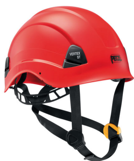
Petzl - Vertex ST

Depuis plus de trente ans, Delta Plus développe, fabrique et distribue des EPI sous plusieurs marques (Panoply, Venitex...) qui allient qualité, confort, technicité, ergonomie et design. Son catalogue regroupe aujourd'hui plus de 1 500 références qui sont conçues dans ses sept sites de fabrication. Bénéficiant d'une grande notoriété en Europe, l'entreprise est présente à l'international via vingt filiales de distribution qui lui permettent d'être proche de ses 10 000 clients.