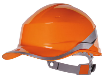
Delta Plus - Baseball Diamond

Fondé en 1879 aux Etats-Unis, le groupe Centurion s'est d'abord illustré dans la fabrication de casques pour mineurs puis pour les militaires, les ouvriers de chantiers navals et enfin pour les motards. Dans les années 1990, il décide de concentrer ses efforts sur le secteur industriel avec la production de casques de sécurité et d'accessoires pour le visage et la protection de l'ouïe. Reconnue à l'échelle mondiale, la marque Centurion est aujourd'hui commercialisée sur les cinq continents.