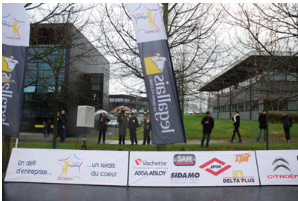
Les fournisseurs-partenaires du Relais