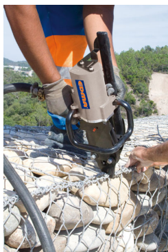
Turbo 50 Gabion

Adaptable sur tous types de perceuses-visseuses, la PowerGraf est une agrafeuse spécialement conçue pour la mise en œuvre de clôtures. Son magasin peut contenir jusqu'à 55 agrafes de type Omega 20 et Delta 22. Pour améliorer encore plus son caractère préventif de TMS, ce magasin peut se positionner d'un côté ou l'autre de l'agrafeuse selon que l'opérateur soit droitier ou gaucher.