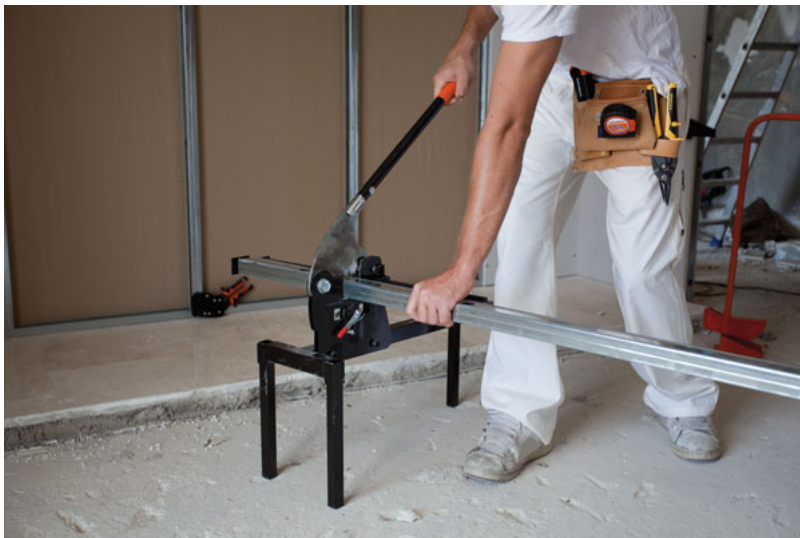
En 1937, Pierre Gréhal, alors ouilleur

Fabricant d'outils à main depuis plus de 75 ans et reconnue dans 60 pays, la société française Edma compte deux sites de production situés à Saint-Raphaël (83) et à Baillet en France (95). Transféré au mois de janvier à dix kilomètres de l'ancienne usine, ce dernier site doit permettre à l'entreprise de poursuivre une cadence de production soutenue, plus de 1,5 million d'outils fabriqués chaque année ainsi qu'une politique d'innovation axée exclusivement sur les besoins des professionnels.