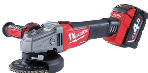
La meuleuse entrant dans le programme d'outils 18 V

Parmi toutes ces nouveautés, nous avons choisi de vous présenter en images trois nouvelles machines du programme 18 volts de Milwaukee, d'ores et déjà disponibles.