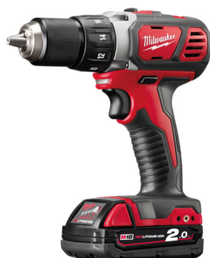
Une nouvelle perceuse visseuse intègre la gamme d'outils sans fil 18 volts

technologie Fuel (moteur sans charbon Powerstate™, batteries RedLithium-Ion et électronique Redlink Plus™) permet, outre le meulage, le tronçonnage et l'ébarbage. Elle est équipée d'un carter de protection orientable sans outil, d'une poignée anti-vibrations, d'un filtre interchangeable contre les poussières et la limaille et d'un système de blocage de l'arbre pour faciliter le changement du disque.