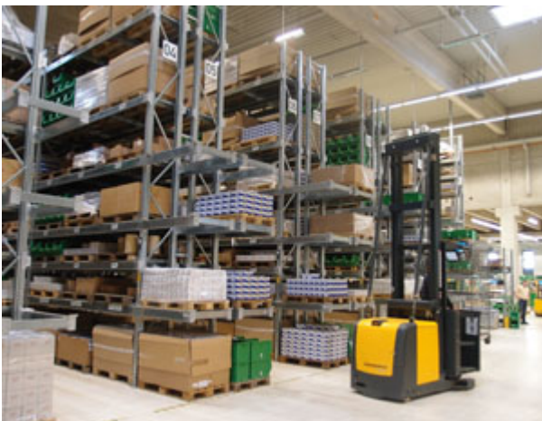
Suite à son rachat d'un terrain de 3 000 m 2 situé en

face de l'usine principale du groupe à Engelskirchen, Lukas-Erzett a pu mettre en service en 2010 sa nouvelle plate-forme logistique centrale déployée sur 5 500 m 2 . Elle a remplacé celle, de dimension plus réduite, qui occupait au sein même de l'usine un emplacement aujourd'hui dédié à la production de meules à polir. Cette plate-forme largement automatisée stocke en permanence 7 000 références, soit l'ensemble de l'offre standard de Lukas-Erzett et nombre de fabrications spéciales. L'équipe de 15 personnes qui y travaille est affectée à la réception des marchandises et à leur contrôle, à la mise en stock, à la préparation de l'ensemble des commandes passées au fabricant (à l'exception de certaines commandes concernant des volumes importants en meules à tronçonner et à ébarber, directement traitées par le site de Chemnitz) puis à l'expédition de celles-