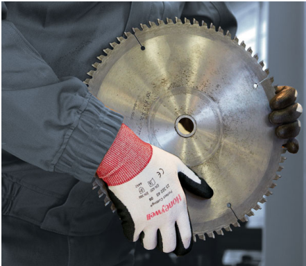
Honeywell Safety Products

protection supplémentaire contre la coupure. Possédant une finition picots au niveau de la paume et des doigts et un renfort dans la pince pour une meilleure protection d'une zone vulnérable de la main, Temp-Dex Plus 720 est adapté aux environnements légèrement humides ou huileux. Ce gant qui répond aux exigences des normes EN 388 (4343) et EN 407 (niveau 2 de performance à la chaleur de contact) est disponible en 3 tailles.