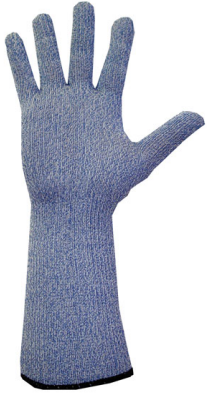
Manusweet Gant anti-coupure ambidextre

sensibilité tactile, MaxiFlex® Elite™ a une forme proche de celle de la main au repos qui réduit la fatigue de l'utilisateur. Sa finition de microcapsules lui confère un excellent grip. Ce gant sans silicone de couleur bleu long de 25 cm est conforme à la directive REACH relative à l'enregistrement, l'évaluation, l'autorisation et la restriction des substances chimiques et certifié Oeko-Tex 100 standard. Il est donc exempt de toutes traces de produits chimiques et d'odeurs issues du traitement et sans risque pour la peau.