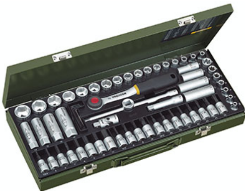
La marque a

parallèlement sorti plusieurs nouveautés produits sur le salon dont : un coffret métal de 65 pièces comprenant une clé à cliquet 3/8", des rallonges et des douilles en chrome vanadium 31 CrV 3 de 6 à 24 mm, des douilles profondes de 10 à 17 mm, des embouts de vissage HX 4 à 11, XZN 5 à 10, TX 15 à 50 et TX E6 à E18, et des douilles pour bougies 14 à 19 mm ; une clé à cliquet compacte 1/4" à 5° d'angle de reprise d'une taille totale de 120 mm (tête de 23 x 12 mm) vendue seule ou dans un coffret métal avec rallonges, articulation, douilles et embouts de vissage ; des douilles Impact de 130 mm de longueur et de diamètres 17, 19 et 21 mm pour les outils à chocs ; une combinaison de douze clés mixtes de faible épaisseur SlimLine conditionnées dans une trousse ; un tournevis orientable à cliquet vendu avec des douilles et des embouts de vissage de petite (25 mm) et grande longueur (80 mm).