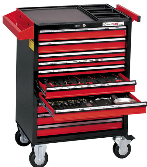
Tool France Promac Servante TT-452

Sonic Equipment lance une servante de grande capacité, la Mega Trolley ou servante établi. Avec ses dimensions généreuses (L 1363 mm x H 1211 mm x P 641 mm), elle est ainsi 150% plus grande qu'une servante standard et dispose de 18 tiroirs offrant de multiples rangements. Livrée seule ou équipée de 533 outils intégrés dans 34 modules mousse Sonic Foam System®, la servante établi est un outil de travail complet et efficace. Fabriquée en acier très résistant recouverte d'une peinture époxy poudrée, cette servante est rehaussée d'un plateau en bois de 35 mm, et dotée de deux bacs à lubrifiants incorporés et d'un dévidoir à papier. Elle dispose de quatre roues (deux fixes et deux rotatives à frein). Sonic Equipment propose des formules de financement ou de la location longue durée sur 13, 24 ou 36 mois.